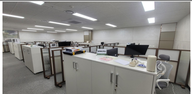
데카콘룸 I (개방형) 사무공간