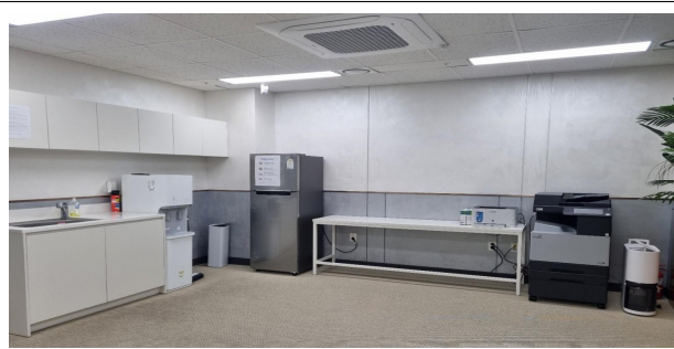
(지정형) 사무공간 내 탕비실