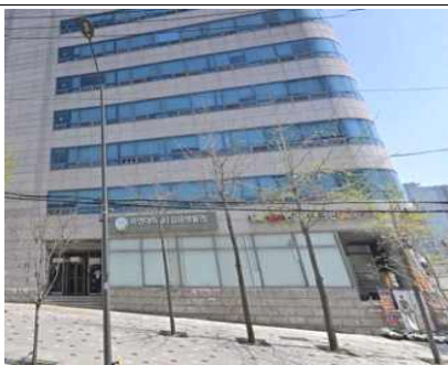
국민대학교 창업보육센터 전경