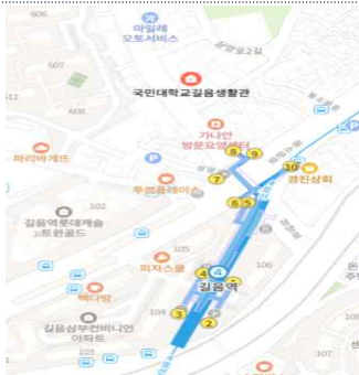
국민대 창업보육센터 위치