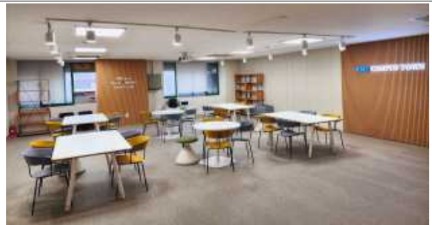
제로원디자인센터 3층 오픈스페이스