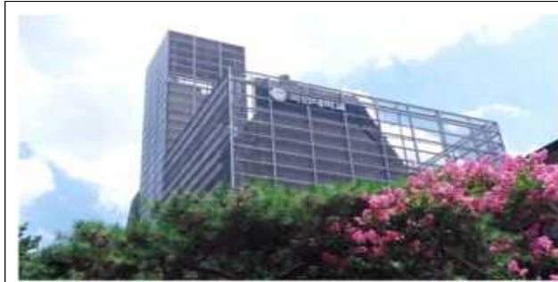
국민대학교 제로원디자인센터 전경