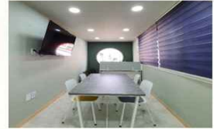
사무실 및 회의실 (2F) 지역과 공유를 위한 커뮤니티 공간