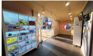
멀티실 (1F) 소자본 예비 창업인이 실제 창업을 개시하기 전에 상품 판매 또는 운영을 경험해 볼 수 있는 공간 덕성여대 학생이 제작한 K-MAKERS 상품을 거래하는 OPEN장터