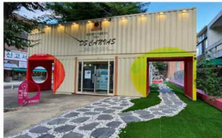
※시반(창업체험)거리 입구 / 멀티실(1F), 사무실 및 회의실(2F)