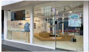
창업부스실 (1F) 캠퍼스타운 입주 창업기업 상품 전시실 및 홍보 영상관