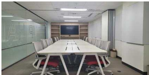
회의실 II (HIT 지하2층)