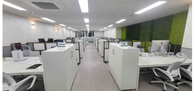
데카콘룸 II(개방형) 사무공간

※ 사무공간 임대료, 관리비 및 사무실 집기 비품 (책상, 의자, 서랍장) 지원 (기타 부가서비스 이용료는 입주기업 부담)