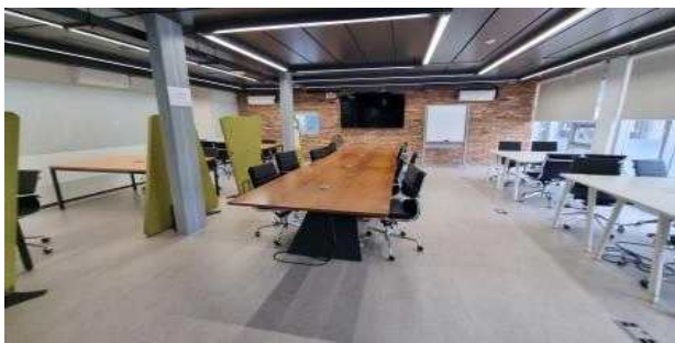
회의실 I (코맥스스타트업타운1층)