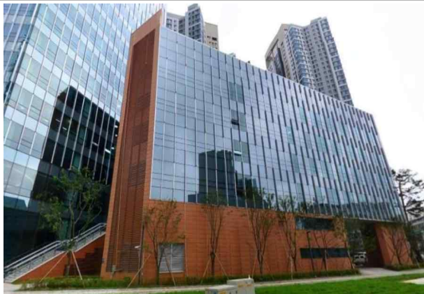
< 용산청년창업지원센터 외관 >