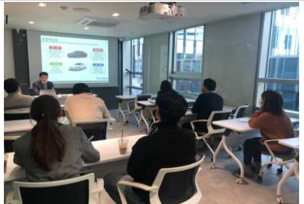
< 용산청년창업지원센터 교육장 >