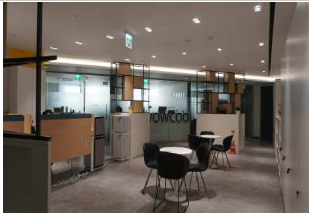
< 용산청년창업지원센터 오픈공간(개방형) >