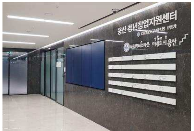
< 용산청년창업지원센터 입구 >